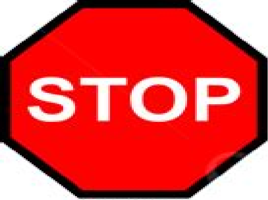
Stop and give way