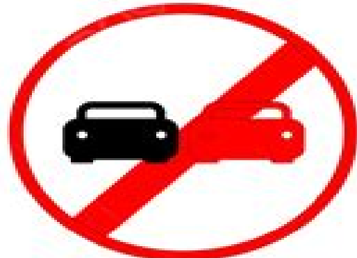
No Over taking